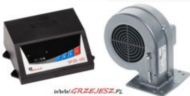
WWW.GRZEJESZ.PL Wszystkie prawa zastrzeżone / Kopieowanie surowo zabronione !